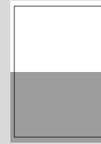
1/2 SEITE QUER