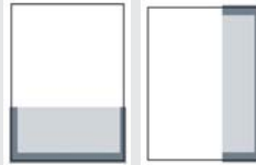
1/3 SEITE QUER ODER HOCH