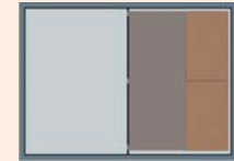
BEIHEFTER DIN A4