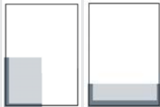
1/4 SEITE ECKFELD ODER QUER