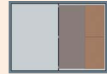
BEIHEFTER DIN A4